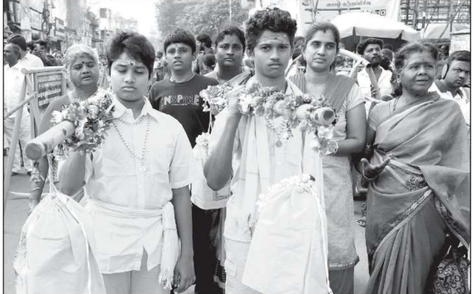
தமிழ்நாடு முழுவதும் முருகன் கோவில்களில் இன்று தைப்பூசம் மிக விமரிசையாக கொண்டாடப்பட்டு வருகிறது.